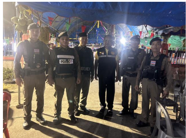
ทำบุญอุทิศส่วน ๆ ณ บ้านยทุ่งโป่ง ม. 10 ต. ทุ่งโป่ง อ.อุบลรัตน์ จ. ขอนแก่น